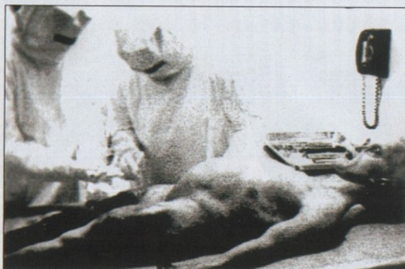
△ Le film de la prétendue autopsie pratiquée sur un extraterrestre en 1947 à Roswell? Après examen, ce document a tout du canular.

L'analyse de véritables documents déclassifiés permettra, au début des années 1990, d'affirmer qu'il s'est bien passé quelque chose de secret à Roswell. Mais les amateurs d'ovnis