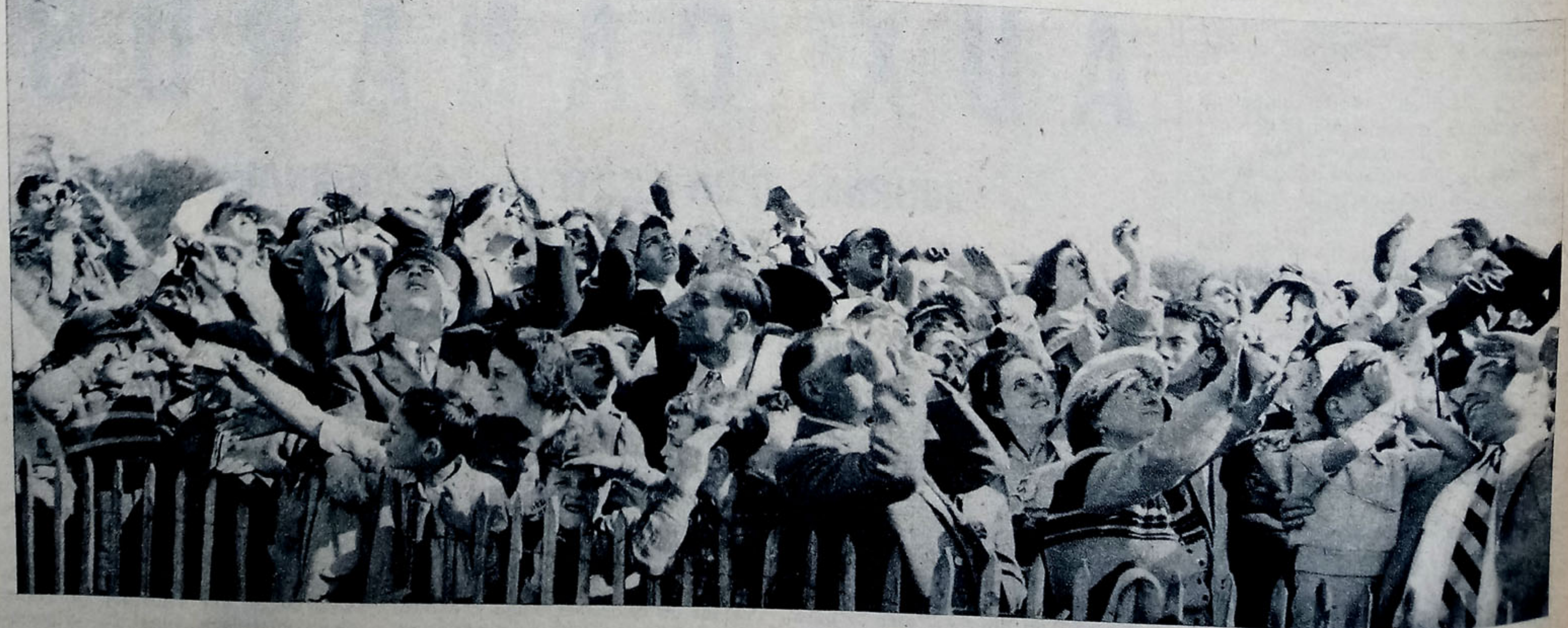
Les soucoupes vont-elles affoler les foules de 1954 tout comme les « brigands » de 1789 ?..

CAROLINE A LES PIEDS PAR TERRE Au point où en est arrivée la grande presse, on ne sera pas surpris d'apprendre que Samedi-Soir devient un des derniers refuges du sérieux. On sait comment deux de ses reporters, déguisés en scaphandriers, munis de lampes de poche et de fumées d'artifice, ont joué les Martiens dans la région de Cahors puis, le lendemain, sont allés enquêter sur leurs propres exploits. Le résultat dépasse toute attente. La Dépêche du Midi, journal peu folâtre, présentait le lendemain « un ensemble troublant de témoignages précis dont les auteurs ne sont pas des rêveurs, des faits dépouillés de tout apport imaginaire... » Et comment le quotidien toulousain ne se fût-il pas laissé convaincre, par la persuasion de braves gens qui, aux mystificateurs eux-mêmes, décrivait l'horrible aspect des envahisseurs nocturnes, la malaisance de leurs rayons X ou Y, la