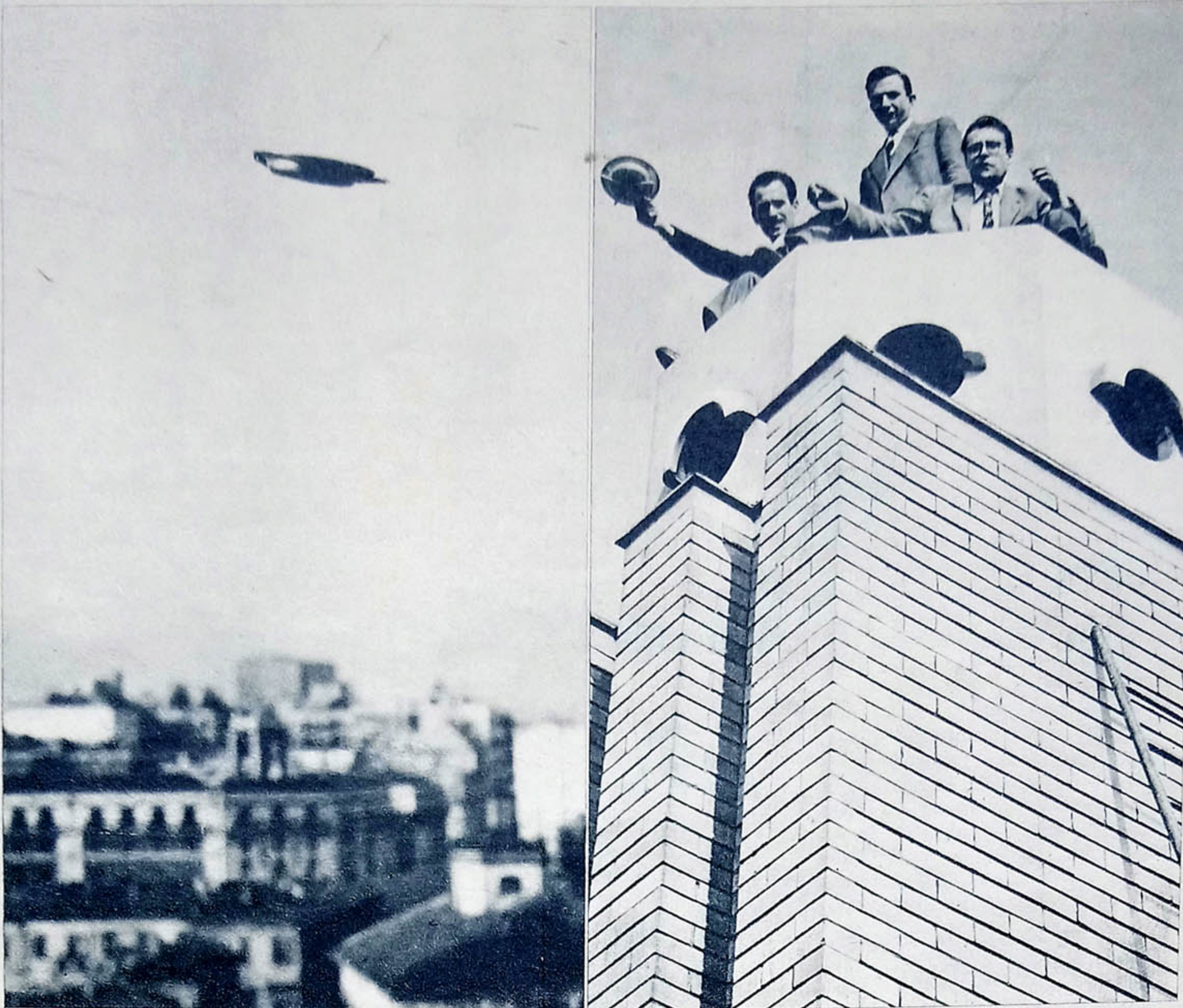
Quelques plaisantins milanais parvinrent à faire évoluer (à l'aide de petites fusées) une véritable soucoupe de métal.

La seule chose qui me ferait douter que les « soucoupes » viennent d'une autre planète, c'est ceci, qui est très simple, qui tombe sous le sens, et dont nul, me semble-t-il, ne s'avise. Il s'agit d'engins volants qui s'apparentent plus ou moins aux avions. Nos premiers avions n'ont même pas soixante ans. Il n'a donc fallu qu'un demi-siècle pour en faire ce qu'ils sont aujourd'hui, presque capables de concurrencer les « soucoupes ». Si ces « soucoupes » venaient d'autres planètes, il serait vraiment stupéfiant que, dans l'infini des âges, elles apparaissent exac-