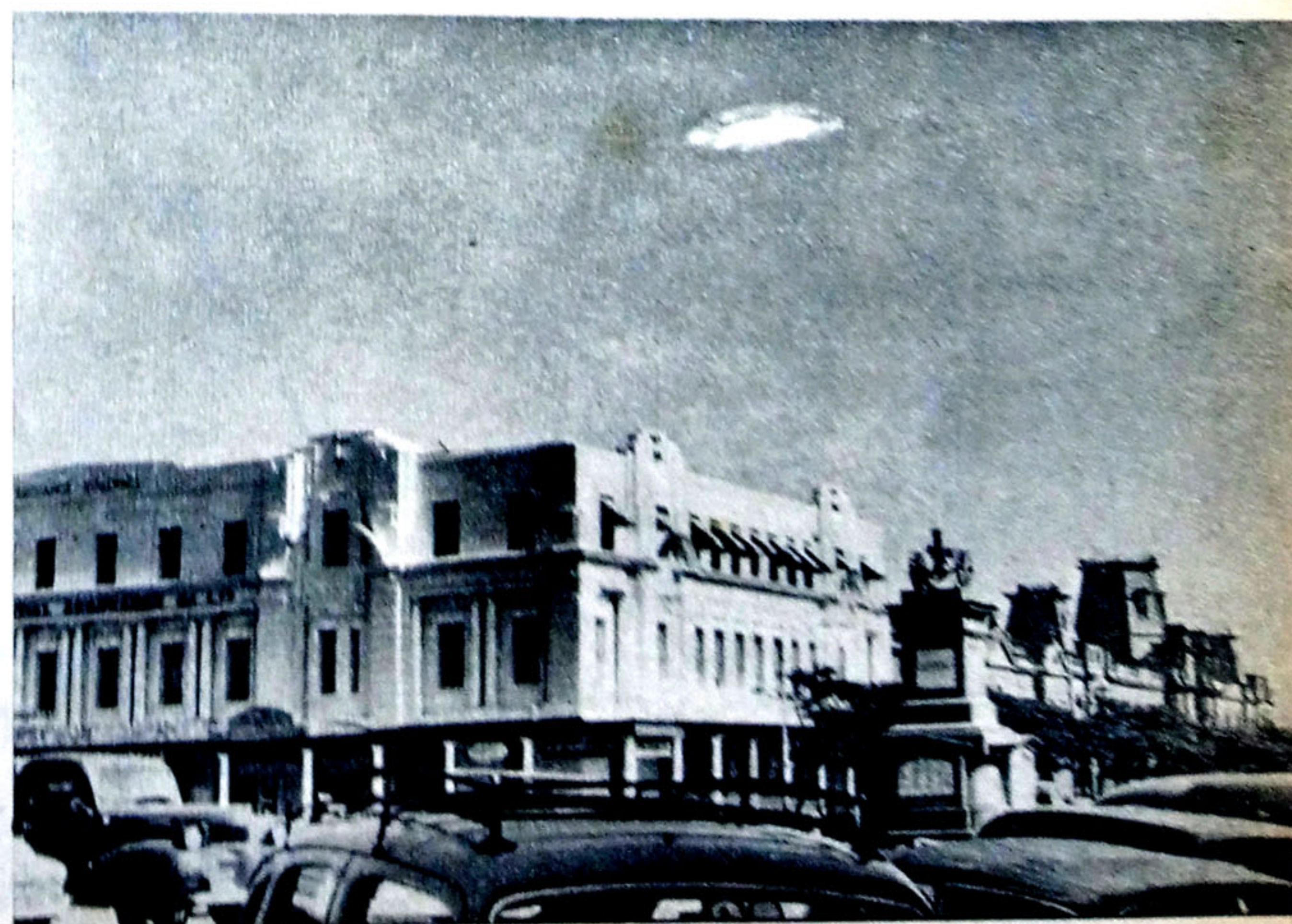
Cet autre cliché d'une soucoupe volante confirme les observations de tous ceux qui ont vu des disques volants : les engins interplanétaires sont extrêmement lumineux et ils se déplacent à des vitesses vertigineuses et sans aucun bruit.