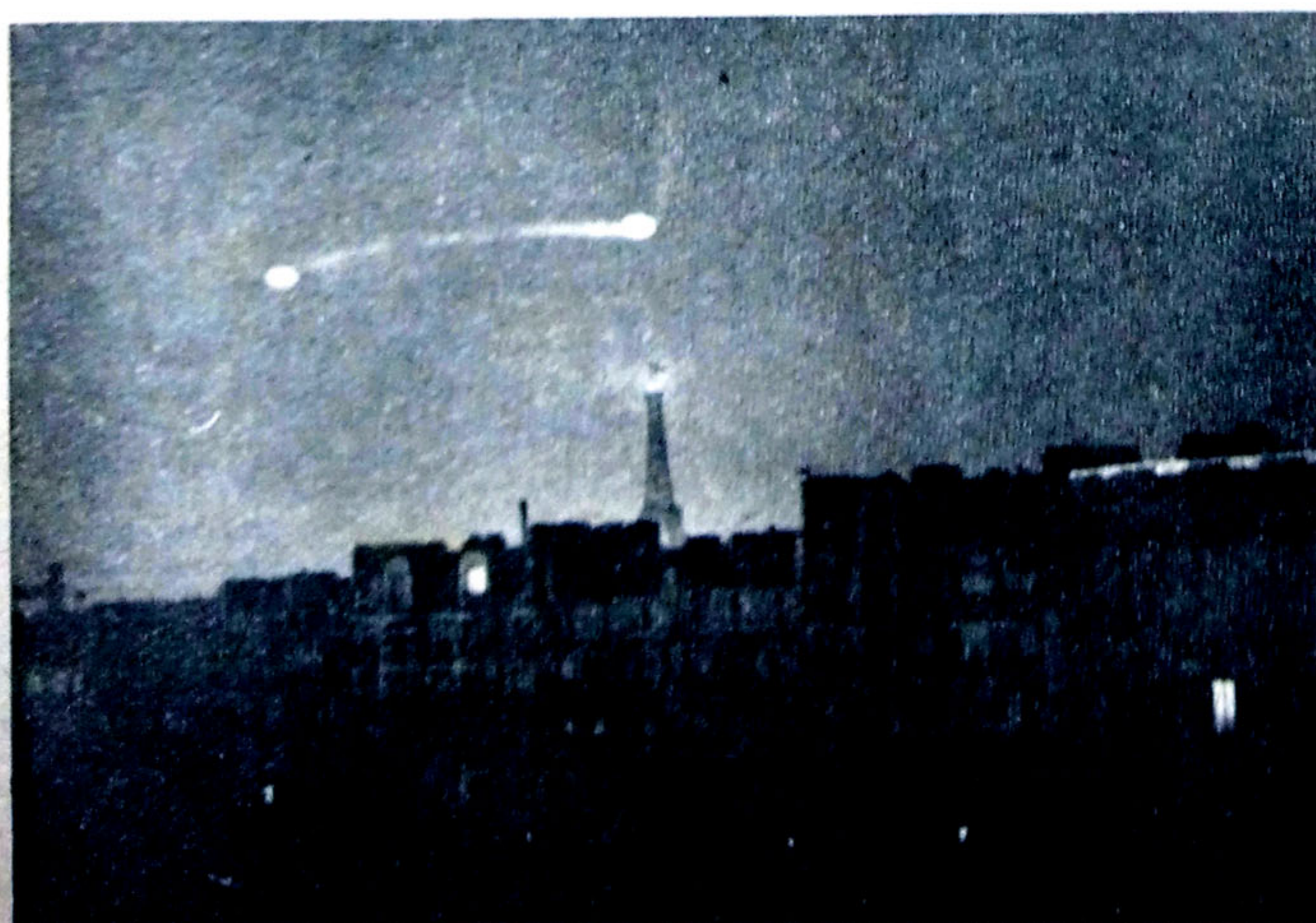
Photographie d'un disque prise à Paris par Paul Paulin, ingénieur, le 29 décembre 1953, à 3 h. 45 du matin. La traînée lumineuse révèle que l'engin, immobile quelques instants, fit un bond et s'arrêta au-dessus la Tour Eiffel.