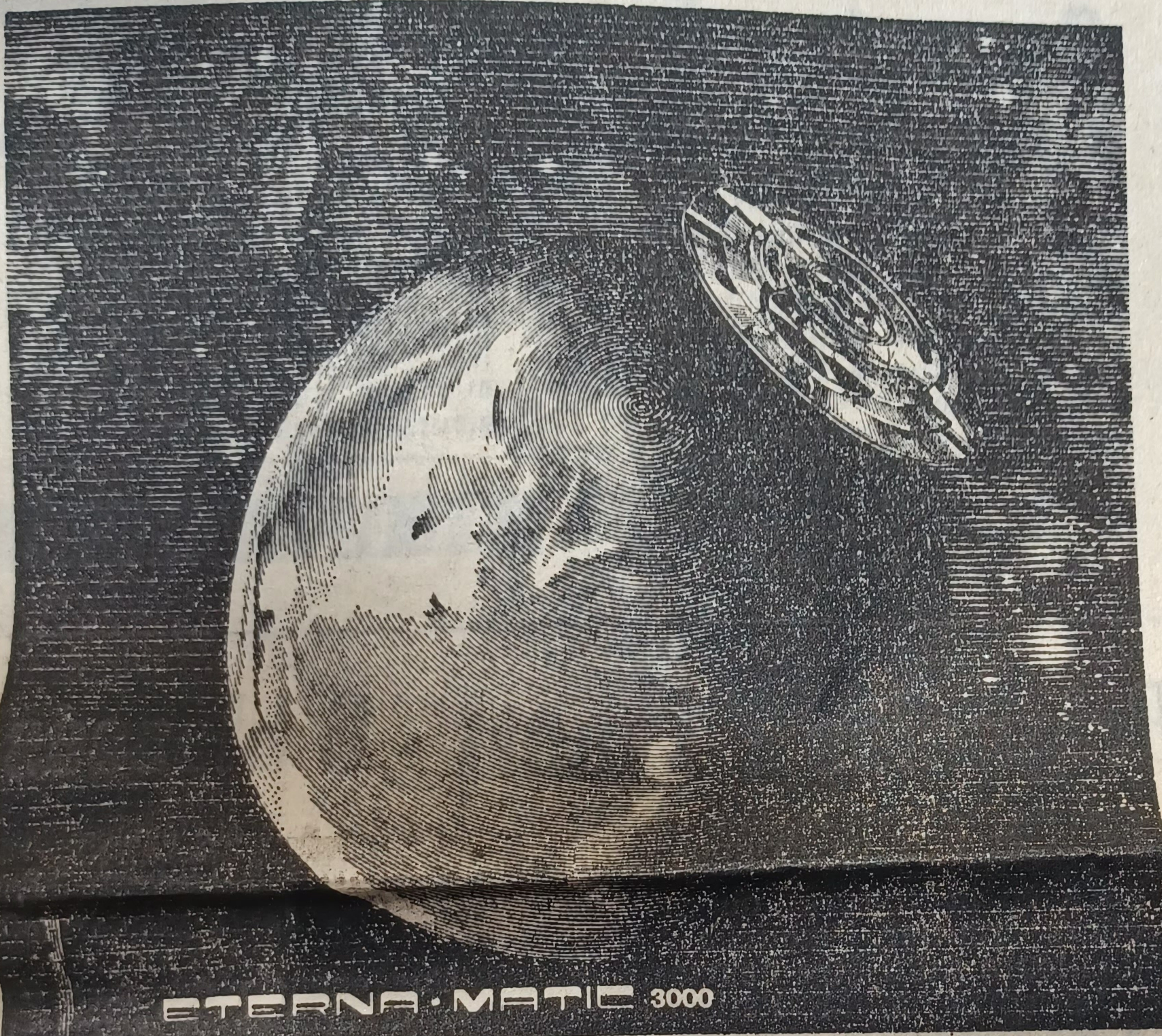
ETERNA · MATIC 3000

Un mouvement de nonces (les « ambassadeurs » du Vatican), est également en préparation, ce qui accrédite encore davantage les bruits de la convocation d'un consistoire.