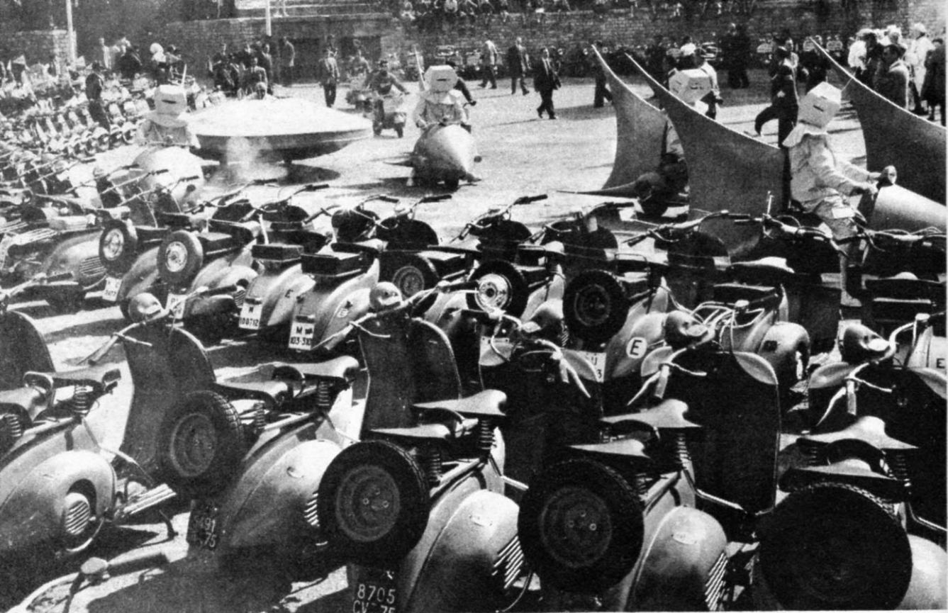
L'arrivée des « Lunaires » dans la vieille Lutèce.