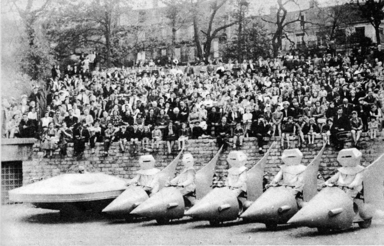
La démonstration des « Lunaires ».