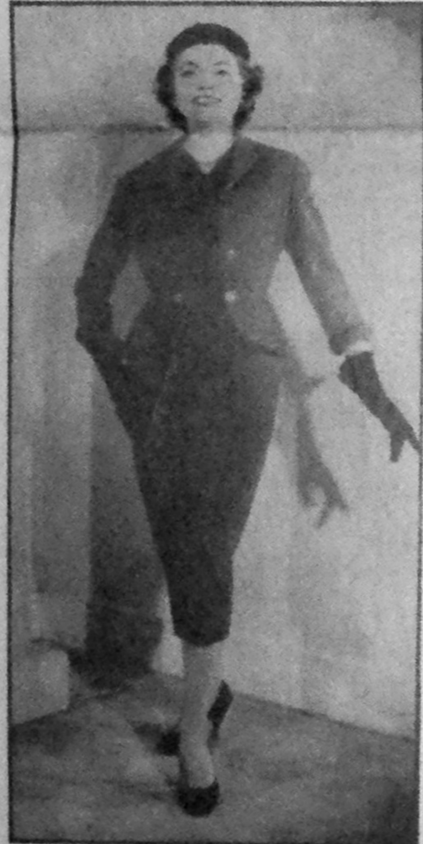
Vêtu baptisé « Laquais » ce trois-pièces en flanelle grise. La veste ajustée, à courtes basques, se boutonne sur un gilet de velours côtelé cerise. Très gracieuse tournure...

PARIS. — Les couturiers en gros ont dû prévoir l'arrivée précoce des jours froids. Car tous ont choisi des tissus qui, épais ou fins, réchauffent les regards autant que les épaules.