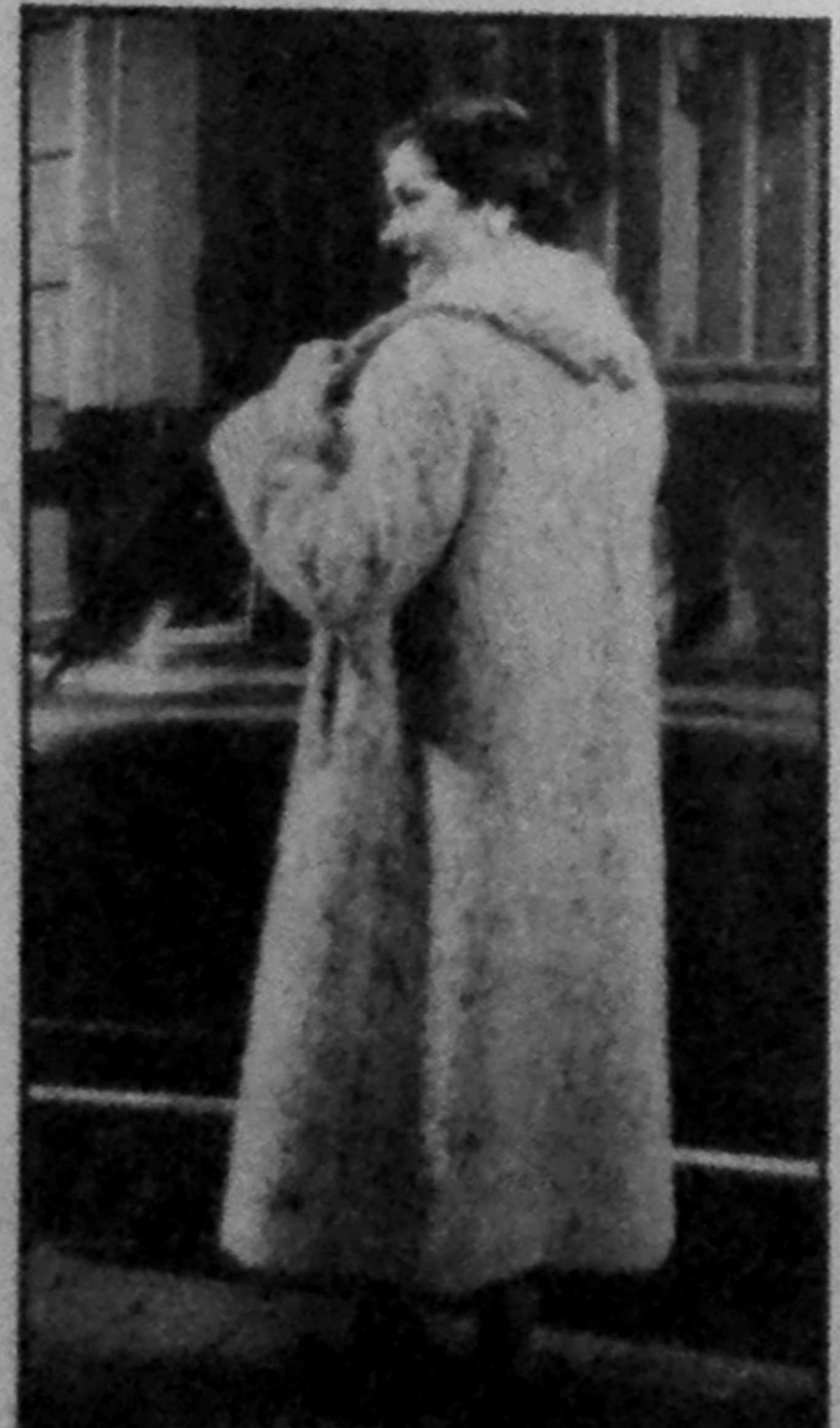
Les longs poils argentés de ce manteau de Wasser donnent presque l'impression de la fourrure. Son col, crané dans le dos, peut se porter relevé afin de mieux garantir la nuque.