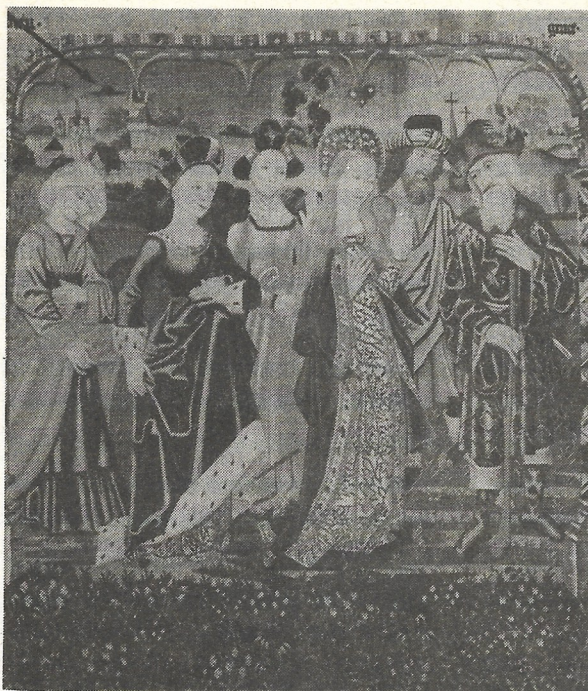
LA CÉLÈBRE TAPISSERIE DE BEAUNE LAISSE PERPLEXE LES CHERCHEURS. L'OBJET QUI APPARAÎT EN HAUT À GAUCHE SERAIT-IL UN OVNI ?

Il existe à Paris une société qui peut produire des effets analogues. Elle utilise de véritables canons de lumière, baptisés sky-tracker (traceur du ciel). Leur puissance est de 7 000 watts, mais il est possible de la monter jusqu'à 13 000 watts. On obtient une barre de lumière qui perce le ciel avec un diamètre de 1 m. L'image obtenue, sur fond nuageux, correspond à un rond de lumière. La colonne d'émission n'est plus visible à ce moment-là. Des témoins peuvent alors facilement voir des ovnis là où il n'y en a pas.