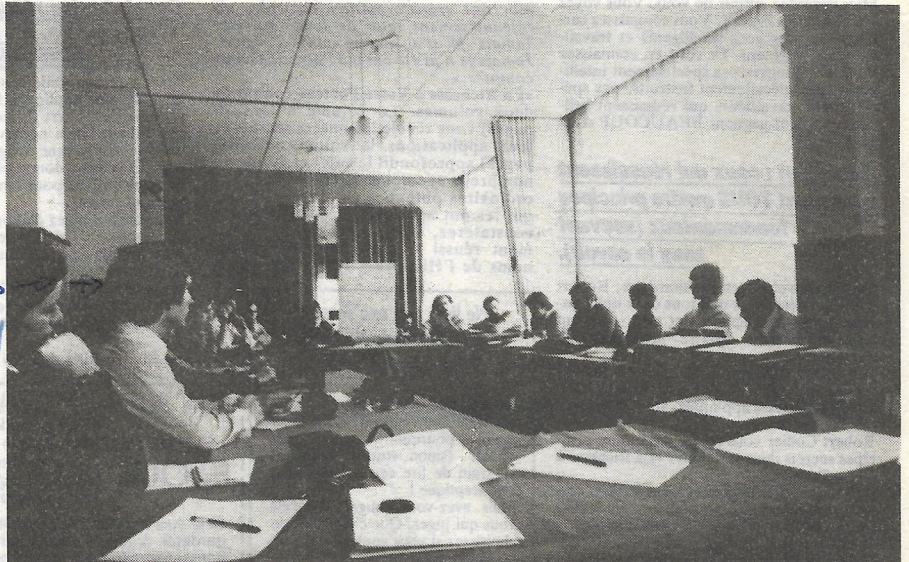
UNE QUARANTAINE DE CHERCHEURS PASSIONNÉS PAR L'UFOLOGIE ASSISTÈRENT AUX RÉUNIONS DE TRAVAIL DU C.N.E.G.U.

Le groupe du Haut-Rhin, le G.H.R.E.P.A., signale qu'au mois de février dernier, au-dessus de Mulhouse, un phénomène aérien