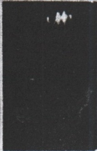
Due immagini dell'avvistamento di Voltri